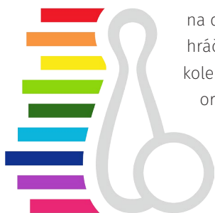
KOMISE MLÁDEŽE ČKA